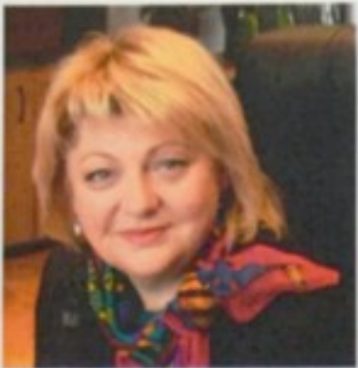
Заступник Голови Фонду державного майна України Лебідь Наталія Петрівна