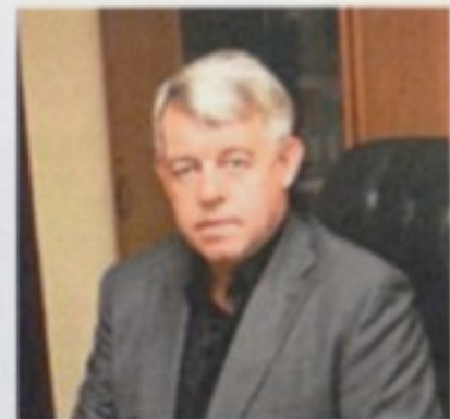
Голова Шал... Мик...