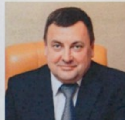
Голова «АС» Євге...