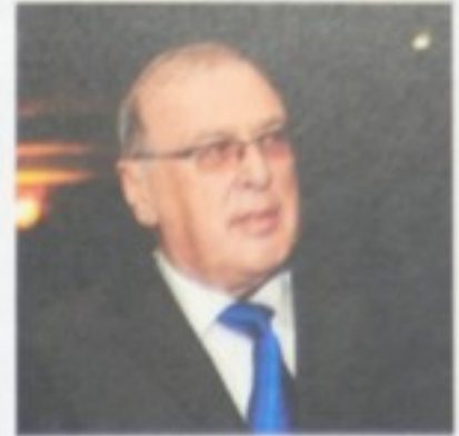
Голова Української асоціації Іса...