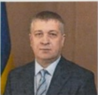
Заступник Міністра юстиції з питань виконавчої служби Шкляр Сергій Володимирович