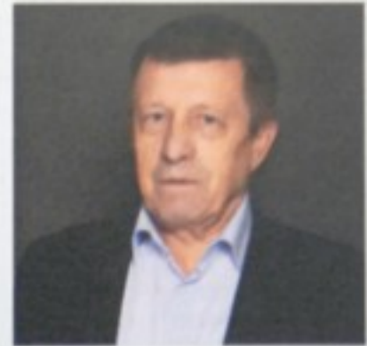
Голова «ВА» Сте...