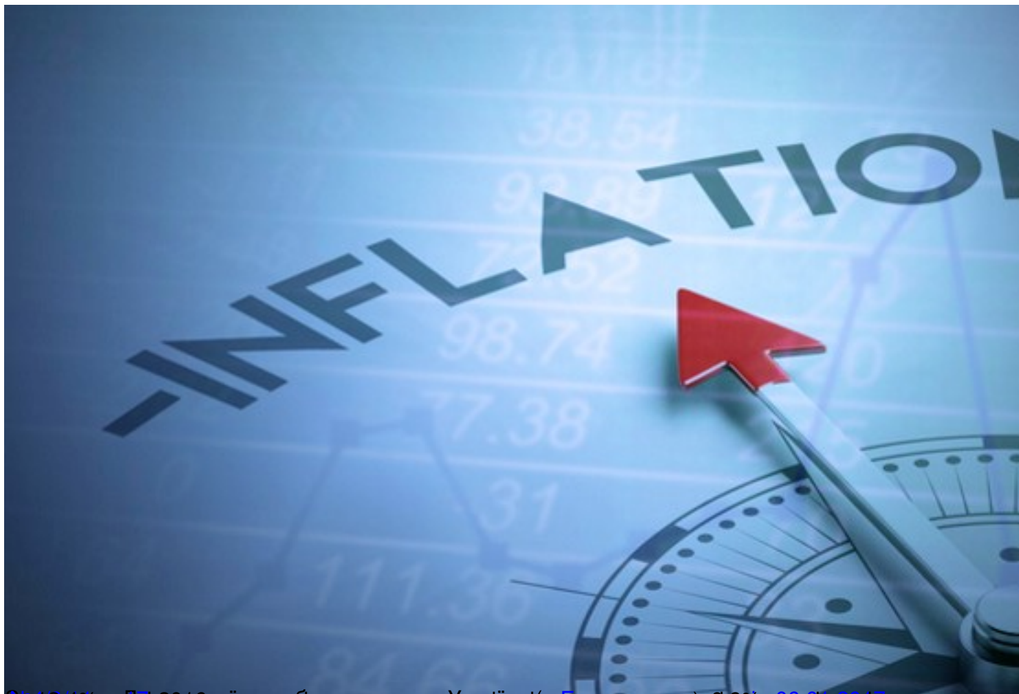
Висхідні темпи інфляції в Україні після виходу з рецесії. У квітні темп зростає на 3,5% до 2016 року.